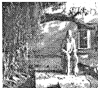
图 2 牛顿思考苹果落地的原因

材料二 启蒙运动的意识形态倾向于把自然哲学家变成英雄，而在法国最伟大的英雄是牛顿……在法国人如伏尔泰和孟德斯鸠的心目中，英国是自由思想和意志自由之源，不过这也是因为他解开了行星之谜，说明它们的运动遵循着与地上运动相同的规律。